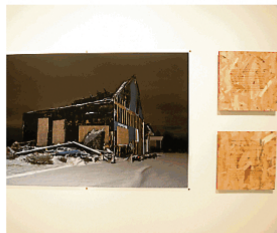
À côté d'une grande photo d'une maison détruite par un incendie, deux histoires évoquant l'intervention de saints sont racontées sur des morceaux de bois dans Mystères vus et entendus (verbatim de miracles) . — PHOTO LE PROGRÈS-DIMANCHE, JEANNOT LÉVESQUE

PHOTO LE PROGRÈS-DIMANCHE, JEANNOT LÉVESQUE